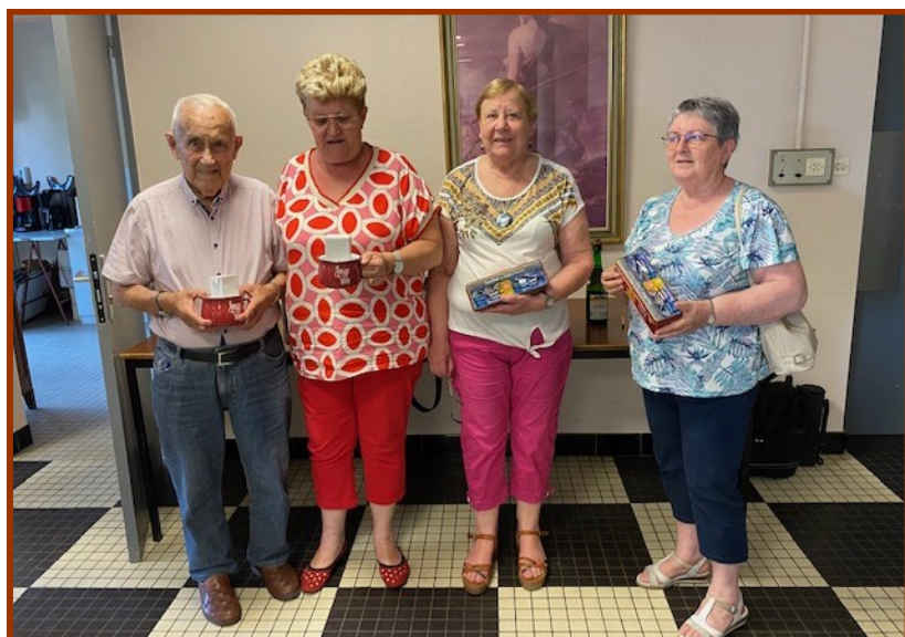
Les 1ers et 2èmes du concours