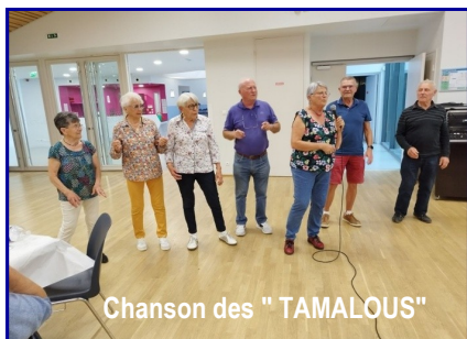
Chanson des "TAMALOUS"