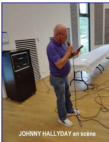
JOHNNY HALLYDAY en scène