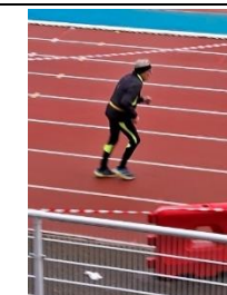
Dans la course de durée, 'on sait quand ça finit...