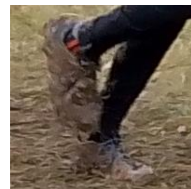
Le cross, c'est souvent dans la gadoue...