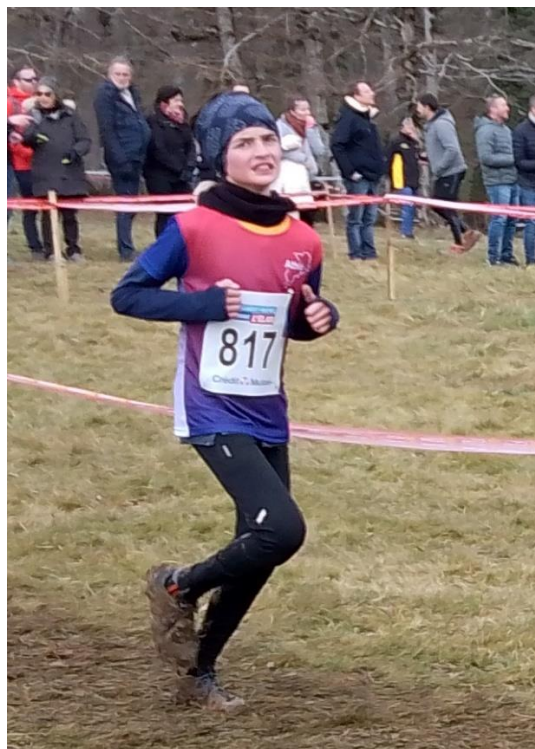
A noter que les nouveaux maillots des équipes de Haute Garonne sont très beaux....