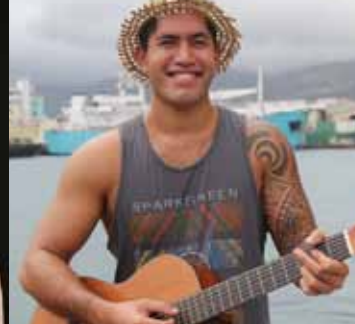
N°3 - Eto Son titre : «I breathe love»