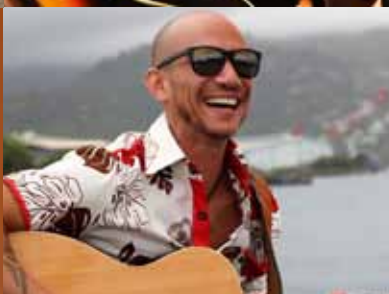
N°5 - Veroarij Son titre : «Tahiti to'u 'e 'a»